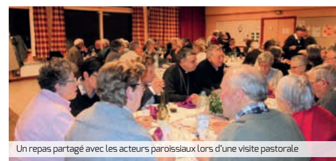
Un repas partagé avec les acteurs paroissiaux lors d'une visite pastorale