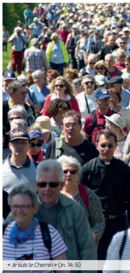
« Je suis le Chemin » (Jn. 14 :6)

À l'appel des six évêques de la province ecclésiastique de Rouen, une grande marche des vocations a été organisée le 5 mai dernier. Dans notre diocèse, près de 1400 personnes ont marché en priant, en discutant ou en méditant durant les 7 km de chemin. Tous étaient invités à réfléchir sur la vocation, et en particulier la vocation sacerdotale. Ce fut d'ailleurs le thème de l'enseignement donné par Mgr Lebrun au château de Mesnières-en-Bray, lieu de départ de la marche, pour lancer la journée. Un grand pique-nique était organisé dans le parc du château, puis chacun a cheminé en direction de l'église Notre-Dame de Neufchâtel-en-Bray, où une messe a été célébrée autour des reliques des saints Louis et Zélie Martin.