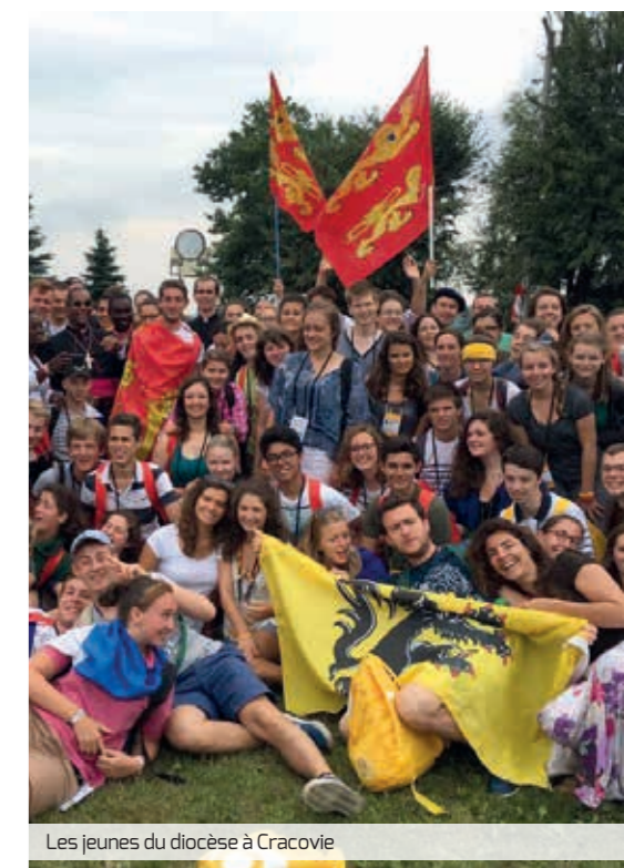
Les jeunes du diocèse à Cracovie