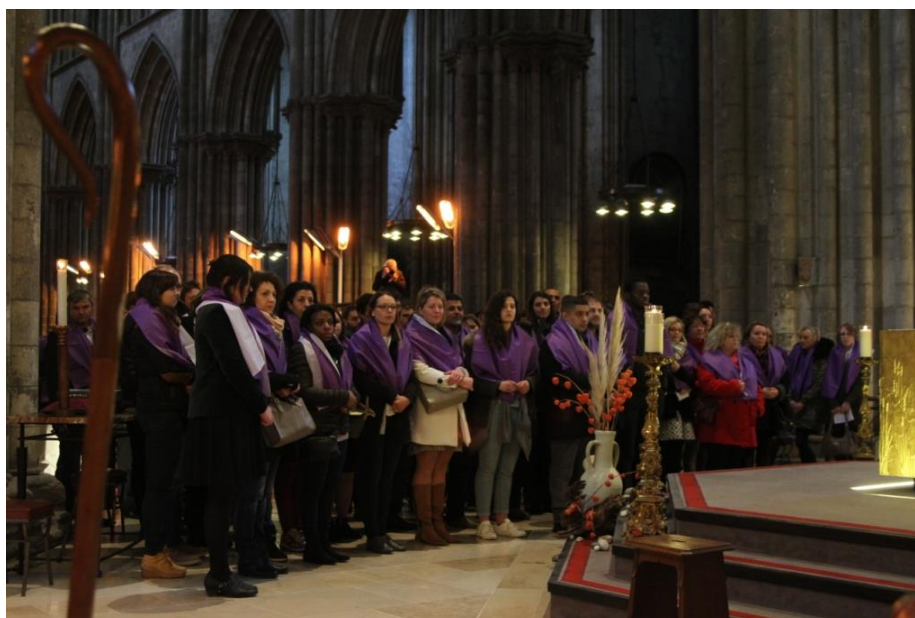
Célébration de l'Appel décisif en 2017

La réception des sacrements (le sacrement est le signe visible d'une réalité invisible) à Pâques lors de la Vigile pascale : le baptême, la confirmation et l'Eucharistie. Cette année le samedi 31 mars.