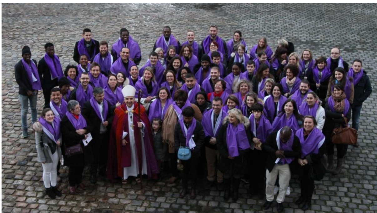
Célébration de l'Appel décisif en 2017