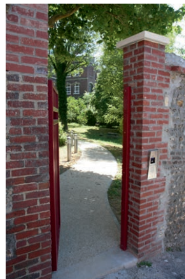
Création d'un accès direct entre la résidence et l'entrée arrière du Centre diocésain (porte et chemin piétonnier)

La deuxième phase, la plus importante, dont l'achèvement est prévu le 30 juin 2016, verra la livraison de 4 autres appartements et de 9 studios (dont 2 studios pour accueillir des conférenciers et des personnes de passages) ainsi qu'un espace de vie commune et une chapelle.