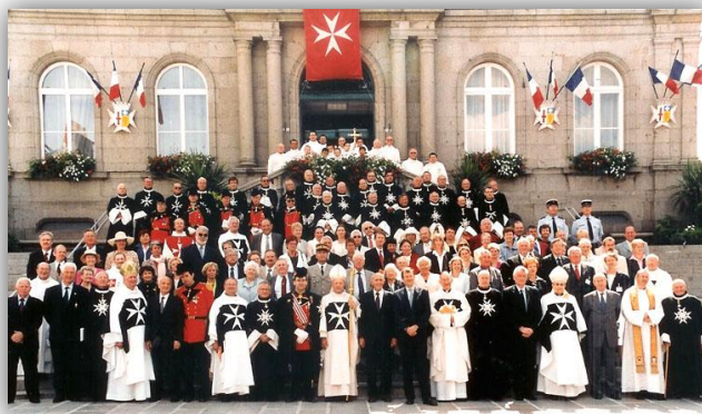
Photo de groupe sur les marches de l'hôtel de ville en 2004

Un point presse sera organisé à la Mairie de Villedieu-les-Poêles-Rouffigny située place de la République le dimanche 22 mai 2016 à partir de 8 heures dans la Salle des Mariages.