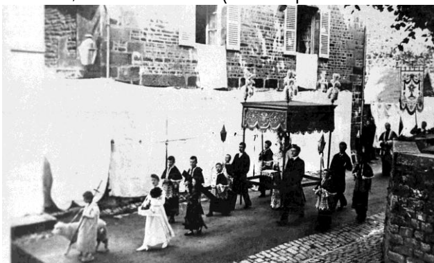
Photo du Grand Sacre de Villedieu en 1905. Musées de Villedieu-les-Poêles.

À la fin du XVI e siècle et au XVII e siècle, en réaction à l'ampleur prise par le protestantisme, de très nombreuses compagnies du Saint-Sacrement naissent dans les paroisses de France. Elles organisent des cérémonies religieuses lors de la Fête-Dieu (début juin). La compagnie créée à Villedieu prend le nom de « Compagnie du Très Saint-Sacrement de l'Autel ». Les fondateurs sont des marchands, officiers, nobles, religieux et bourgeois locaux. La spécificité de Villedieu, nullius diocesis (n'étant pas rattachée à un diocèse) oblige ce groupe de fondateurs à