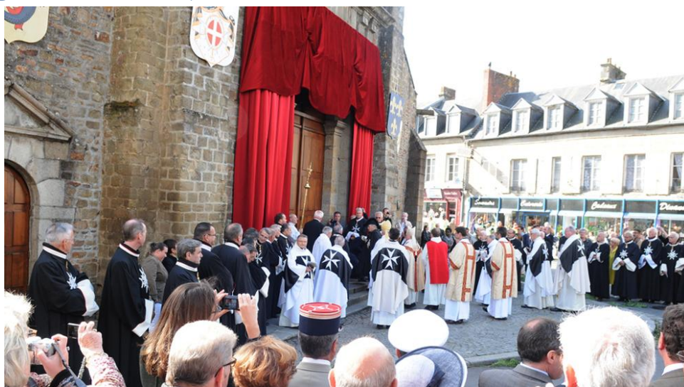
Ci-dessus, l'église lors du Grand Sacre 2012