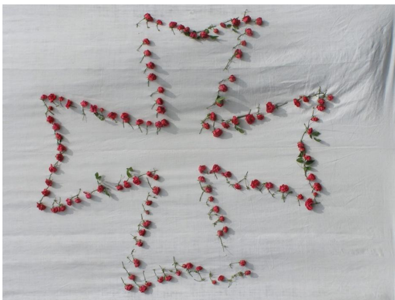
Drap décoré de fleurs rouges dessinant la croix de Malte. Grand Sacre 2012

Site dédié Grand Sacre : www.villedieu-grandsacre.fr