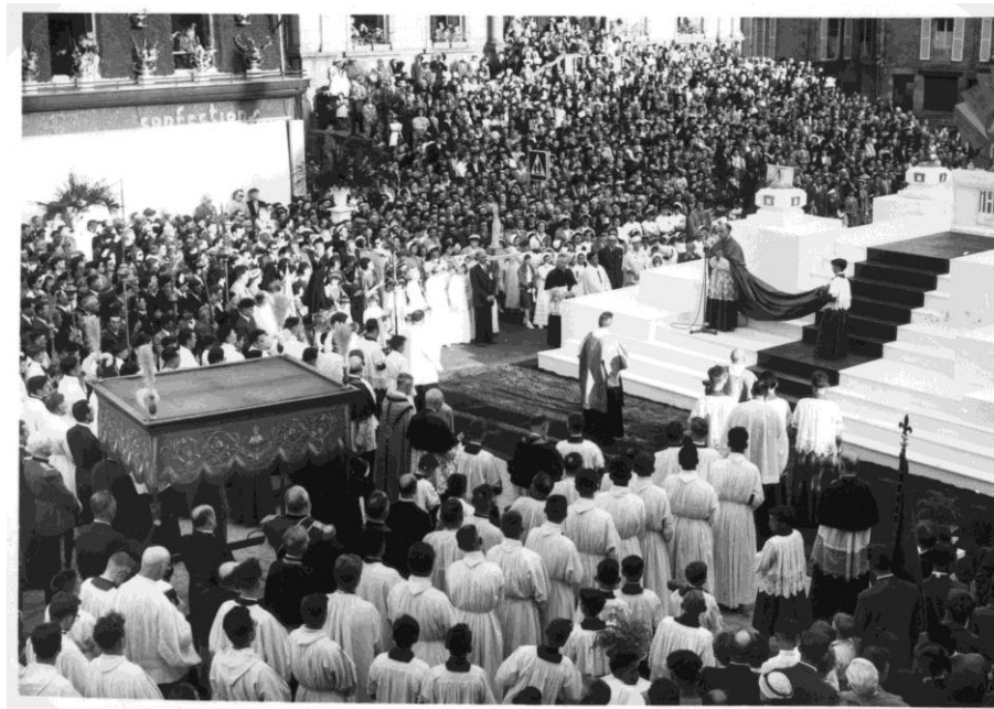
Grand Sacre de Villedieu en 1955. Musées de Villedieu-les-Poêles.

Traversant les siècles et les époques, le Grand Sacre de Villedieu fut parfois amené à s'interrompre pour diverses raisons historiques (Révolution, guerres, etc.) mais il fut toujours réinstauré. Trois cents ans après sa fondation, c'est à l'initiative du clergé local qu'une délégation de 23 Chevaliers de Malte participe à la cérémonie qui se déroule le 26 juin 1955.