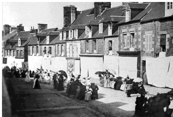
Photo du Grand Sacre de Villedieu en 1905.