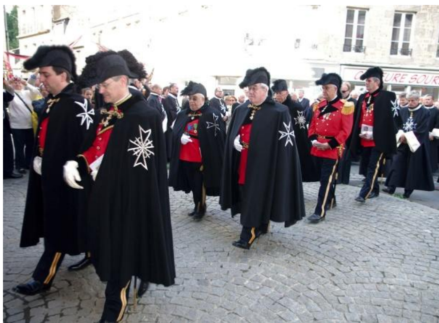
Grand Sacre de Villedieu en 2012.

Depuis, les Chevaliers de Malte ont participé à tous les Grands Sacres, et renoué avec une tradition pluriséculaire.