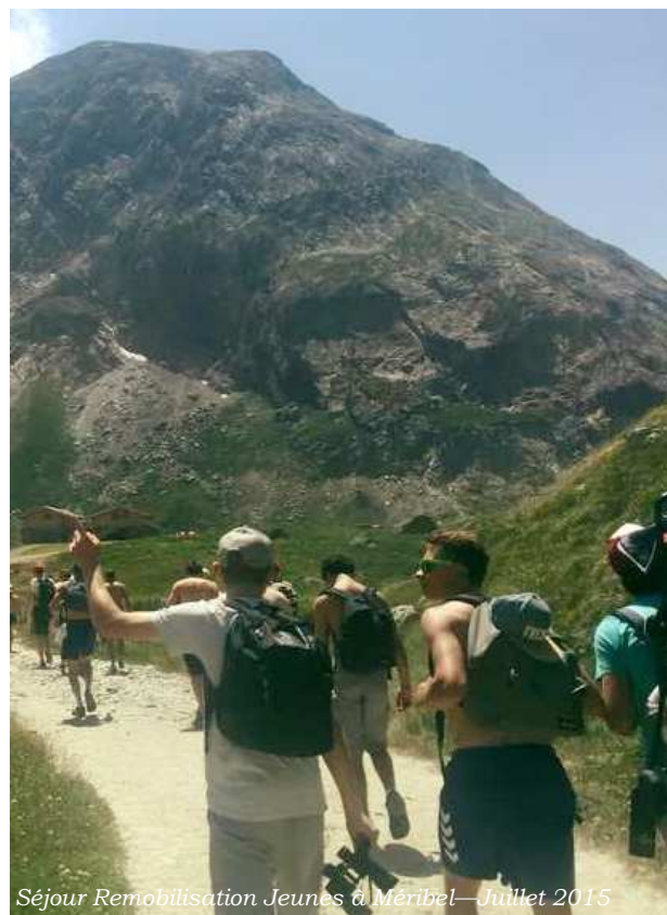
Séjour Remobilisation Jeunes à Méribel—Juillet 2015