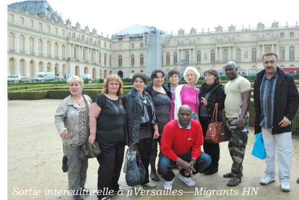
Sortie interculturelle à Versailles—Migrants HN