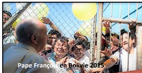
Pape François en Bolivie 2015