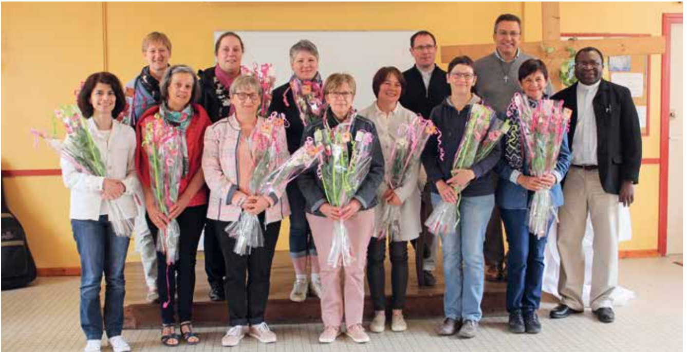
Les mamans ravies de leur rencontre.

Le samedi 12 mai, dans la salle paroissiale de Gournay, les paroisses de Blainville-Buchy, Forges et Gournay avaient convié les mamans pour un moment d'échange sur le thème «comment-vivre sa foi en famille»