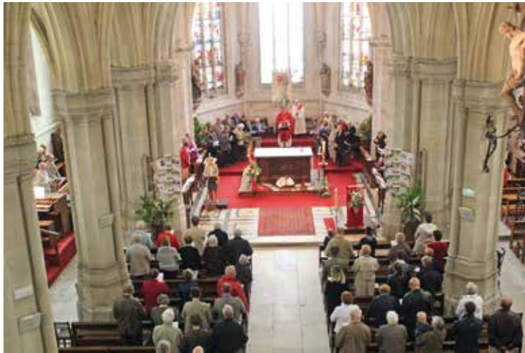
Réunion des diffuseurs à la messe de la Pentecôte à Buchy

s'est déroulée dans l'église de Buchy, lors de la messe de la Pentecôte. Inviter les distributeurs à participer à l'eucharistie dominicale était un formidable témoignage de fraternité pour toutes les per-