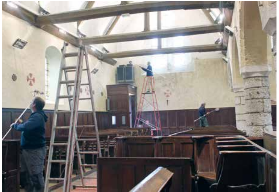
Avec de l'huile de coude, tout est possible...