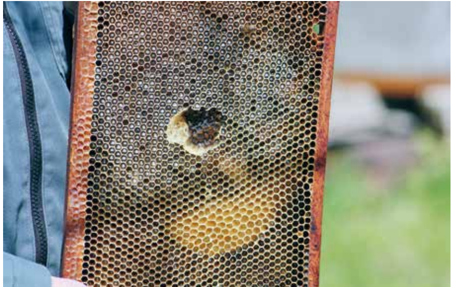
Les abeilles ont bien butiné.

En plus de la fécondation des plantes, les abeilles nous offrent leurs produits: la cire et surtout le miel, seul produit sucrant naturel pour l'homme, avec des propriétés très intéressantes pour la santé (actions digestives, laxative, anti-toux, antitoxique, antiseptique,