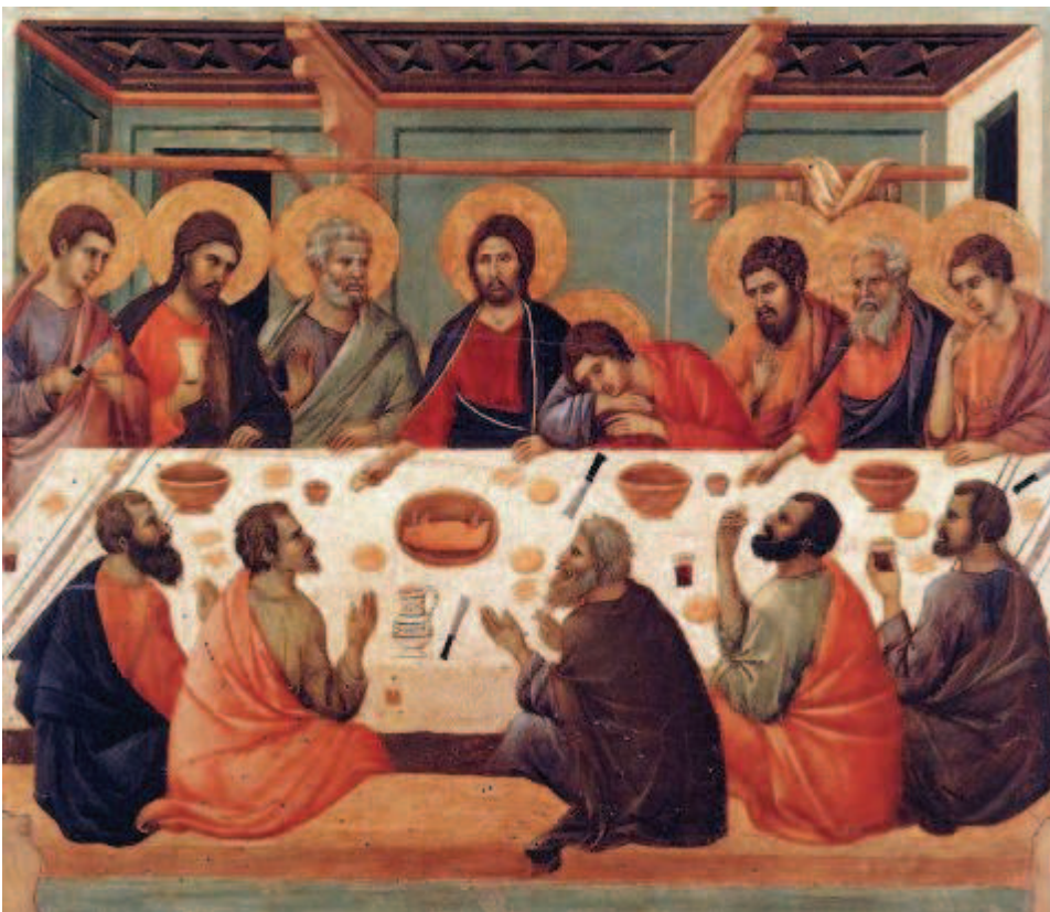
Duccio, Sienne (XIV ème siècle)