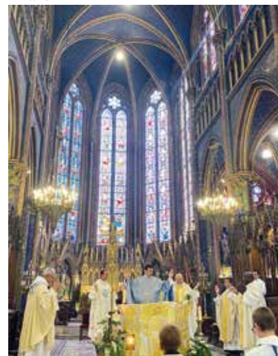
Ils ont dit une première messe à Bonsecours, le mercredi 6 juillet.