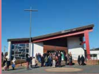
Saint Jean Bosco