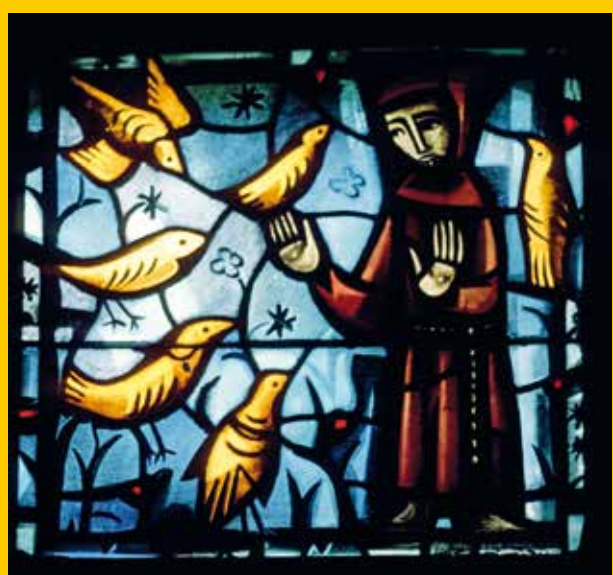
Saint François d'Assise parlant aux oiseaux. Vitrail à Taizé

Saint François, fidèle à l'écriture, nous propose de reconnaître la nature comme un splendide livre dans lequel Dieu nous parle et nous révèle quelque chose de sa beauté et de sa bonté : «La grandeur et la beauté des créatures font contempler, par analogie, leur Auteur» (Sg 13, 5), et «ce que Dieu a d'invisible depuis la création du monde se laisse voir à l'intelligence à travers ses œuvres, son éternelle puissance et sa divinité» (Rm 1, 20). C'est pourquoi il demandait qu'au couvent on laisse toujours une partie du jardin sans la cultiver, pour qu'y croissent les herbes sauvages, de sorte que ceux qui les admirent puissent élever leur pensée vers Dieu, auteur de tant de beauté. Le monde est plus qu'un problème à résoudre, il est un mystère joyeux que nous contemplons dans la joie et dans la louange.