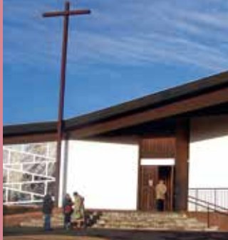
Saint Jean Bosco