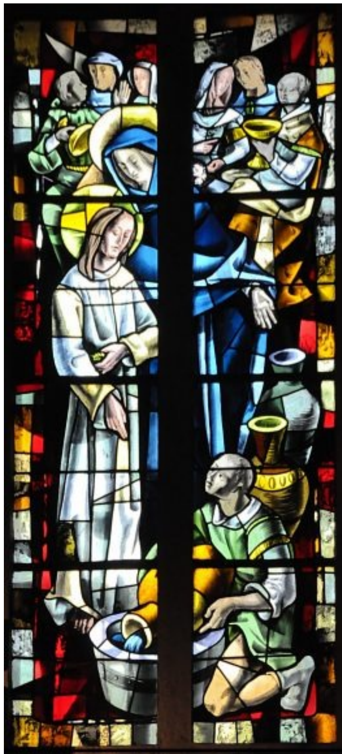
détail du vitrail de la chapelle de l'église d'Yvetot, les noces de Cana