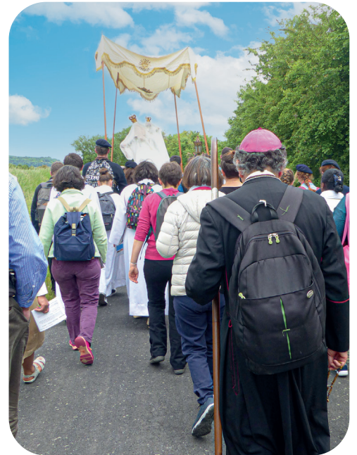
Marche des vocations