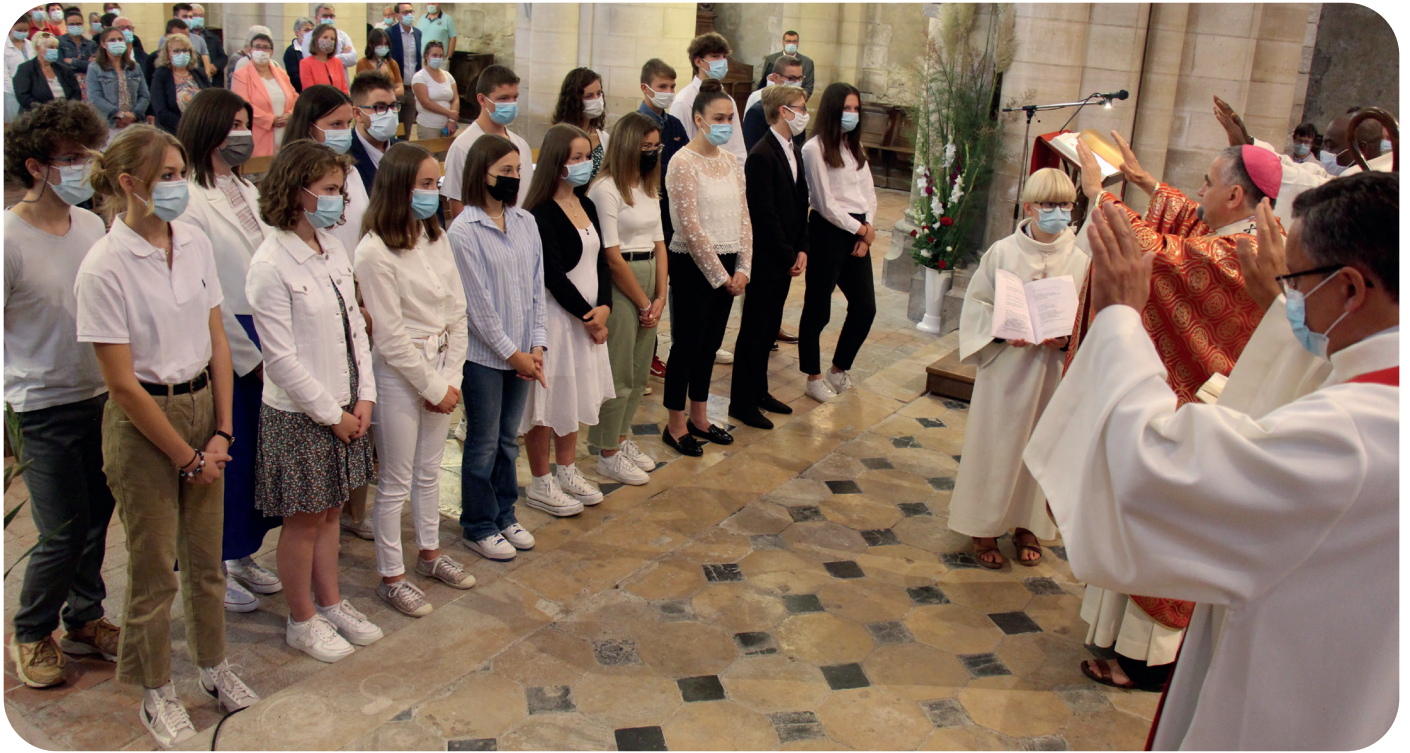
Confirmation en la collégiale de Gournay en Bray

Pour votre famille, un legs à l'Église est un acte chargé de sens , c'est un message de votre part, une affirmation de votre foi, de vos convictions profondes, de vos choix et de vos priorités au-delà de la mort.