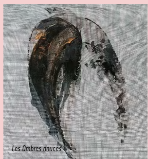
Les Ombres douces