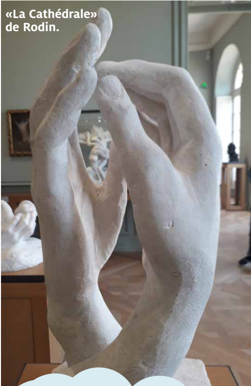
«La Cathédrale» de Rodin.

«Mon «ciel», il est plutôt sur terre avec tous les hommes et femmes de bonne volonté qui s'emploient à rendre ce monde meilleur»