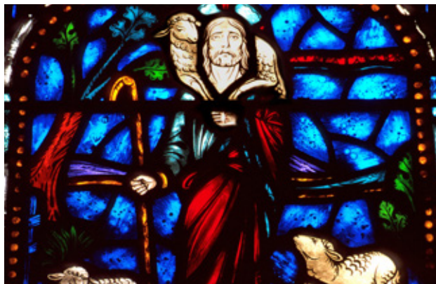
FABRICE BAULT - CHIC