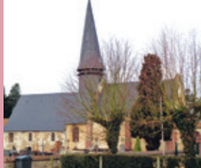
Saint-Pierre de Gouy