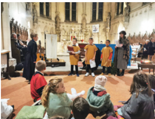
Conte de Noël.