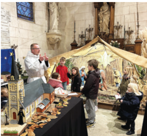
Crèche de Noël à FB.