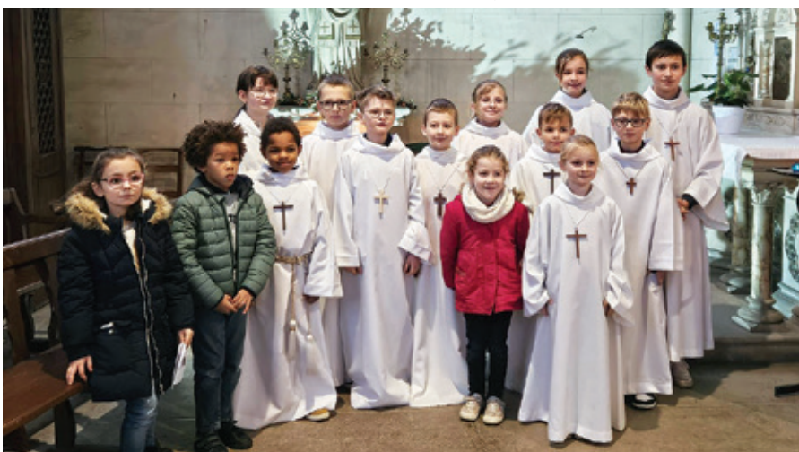
Groupe d'enfants à Noël.