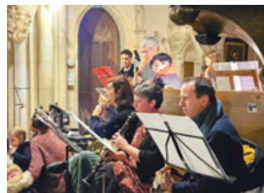
Le groupe des musiciens.