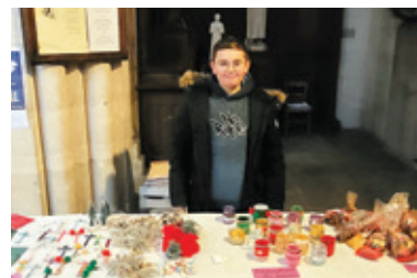
Bricolage et vente de Noël.